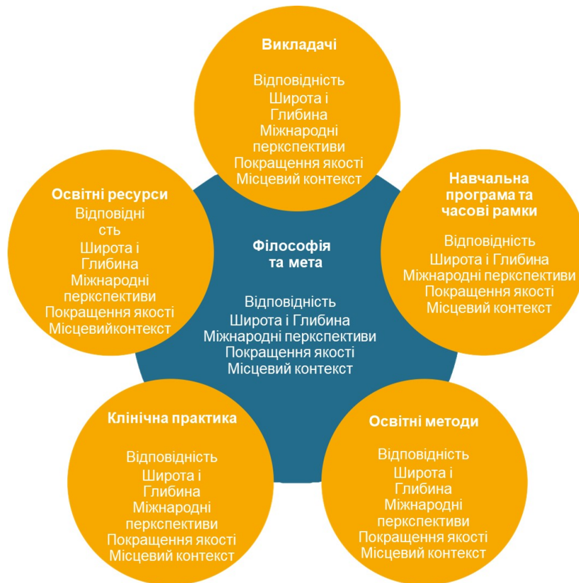
Рисунок 4. Критерії оцінки освітніх програм для ерготерапевтів

Примітки нижче, написані курсивом, пояснюють аспекти стандарту або те, як стандарт може бути виконаний. Ці приклади жодним чином не є довершеними і не означають, що вони є обов'язковими компонентами всіх навчальних програм з ерготерапії.