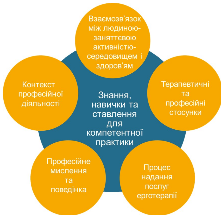
Рис. 3. Основні сфери знань, навичок і переконання для компетентної практичної діяльності випускників